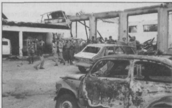
Afb. 5 Het door de Serven in brand geschoten politiebureau van Gospic

aan het conflict in Joegoslavië wordt besteed, is de doorsnee-Nederlander goed op de hoogte van het al dan niet succesvol optreden van de monitor-missie. Haar resultaten zijn moeilijk objectief meetbaar. Ze worden veelal beoordeeld naar gelang de intensiteit van de gevechten, de uitbreiding van de conflictgebieden en het aantal malen dat een staakt-het-vuren (op dit moment — 20 nov. 1991 — is de 14e overeenkomst van kracht) wordt overeengekomen en weer met voeten getreden. De eerlijkheid gebiedt te stellen dat de monitor-missie afhankelijk is van de door politici bereikte resultaten en dat derhalve een staakt-het-vuren en, in een later stadium, vrede slechts op diplomatiek niveau in Den Haag of in New York kunnen worden afgedwongen.