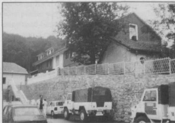
Afb. 4 Het Regional centre te Belgrado dat medio september in Avala werd ingericht

De rol van de monitors bleef aanvankelijk beperkt tot het letterlijk waarnemen van activiteiten (afb. 5). Gezien de ervaring die vele monitors in VN-operaties hadden opgedaan veranderde die taak langzamerhand in een actievere rol. Gesteund door aanvullende instructies van de EG traden de monitors meer en meer op als bemiddelaars tussen strijdende partijen, brachten ze aan de onderhandelingsafel, bevorderden zodoende plaatselij-