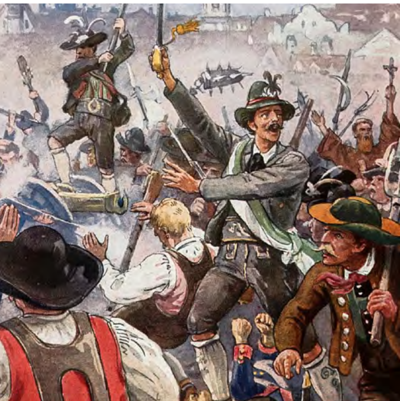
As a teacher at the Berlin War College, Clausewitz lectured and wrote on small wars by analysing the Uprising in Tirol (1809), as well as the Spanish Guerrilla (1809)

Contrary to his critics’ opinions, Clausewitz can be seen as an ‘innovative theorist of small asymmetric wars’. 53 He can be considered as having laid the foundations for modern thinking on asymmetric warfare by examining in On War the relation between a stronger and weaker adversary 54 and the advantages of the defence