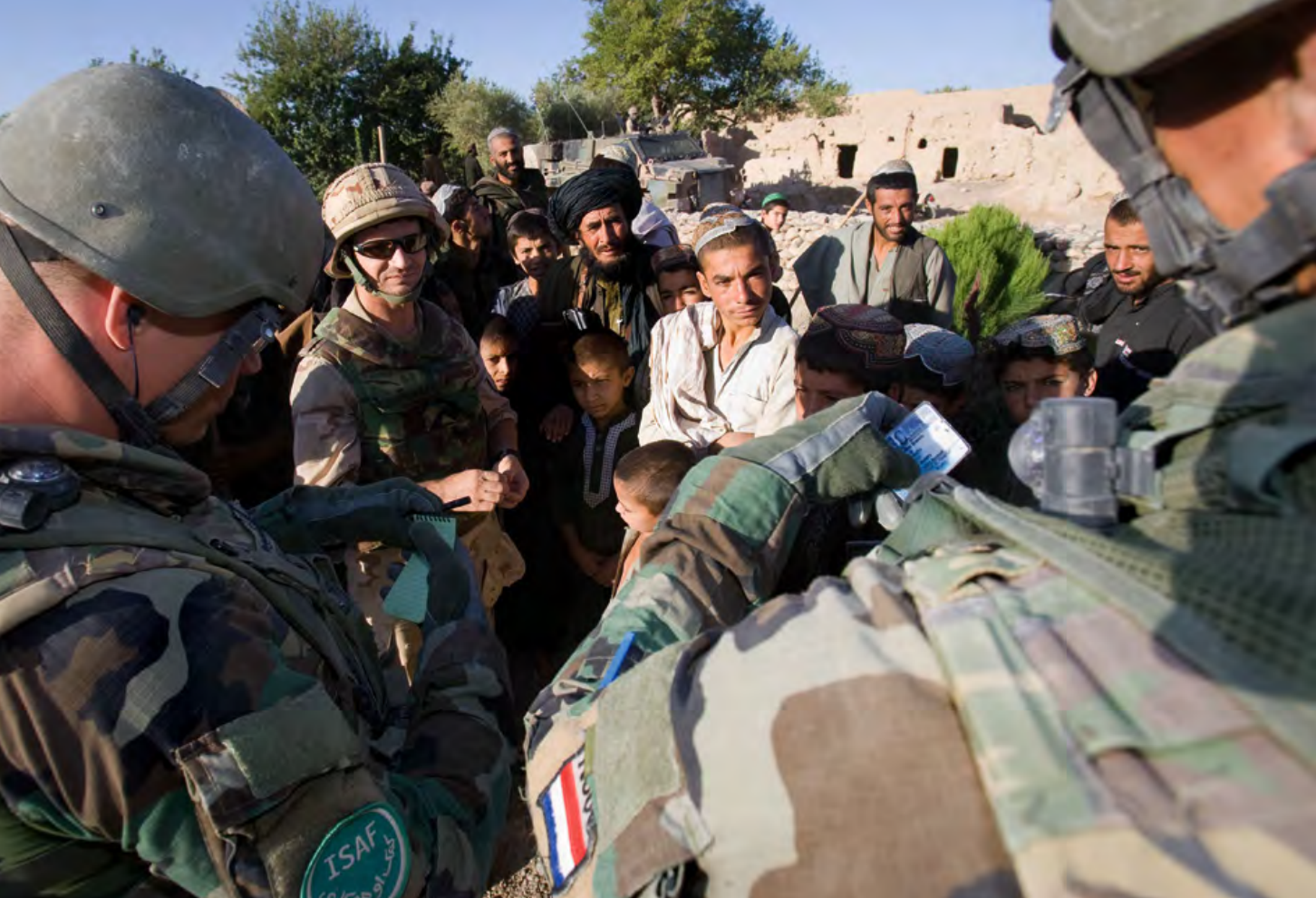
De meerdaagse operatie Ghat Mahay, Afghanistan. Situaties gerelateerd aan de lokale cultuur, bijvoorbeeld de omgang met vrouwen en kinderen, behoren ook tot de 'dagelijkse morele uitdagingen' tijdens uitzendingen