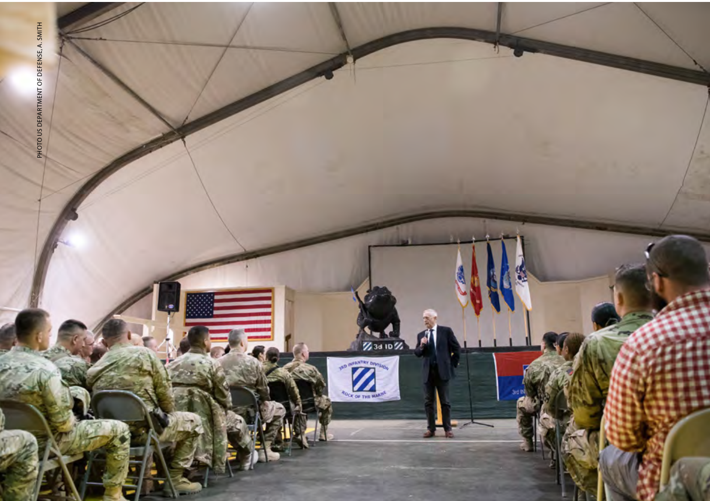
Retired US General and current Secretary of Defence James Mattis during a Q&A session with U.S. Forces on Bagram Airfield, Afghanistan: Mattis admits he doesn't have all the answers, but says reading gives him valuable insights