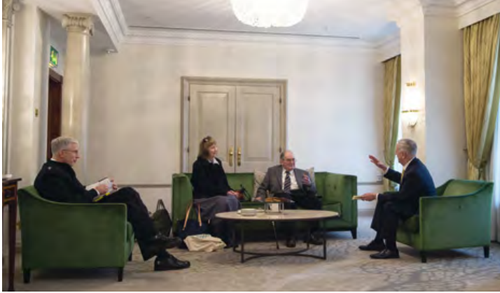
James Mattis (right) and Colin S. Gray (second from right) discuss contemporary and historical military topics. According to Gray Clausewitz's On War must be read and re-read to grasp its full meaning.

particular information technology – the disrupting factors that Clausewitz considered integral to the nature of war – uncertainty, danger, fear, courage, chance and friction – could be devalued or made redundant. 12 This article addresses the question whether the historical thinker Clausewitz's main work On War is still relevant in the world of today's conflict.