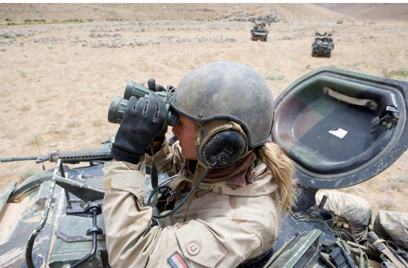
Operatie Cheranak, Afghanistan. Uit het onderzoek komt naar voren dat er geen significante verschillen zijn tussen militaire leiders en hun ondergeschikten wanneer het gaat om het aantal morele uitdagingen dat zij noemen en het gebruik van de verschillende responsstrategieën