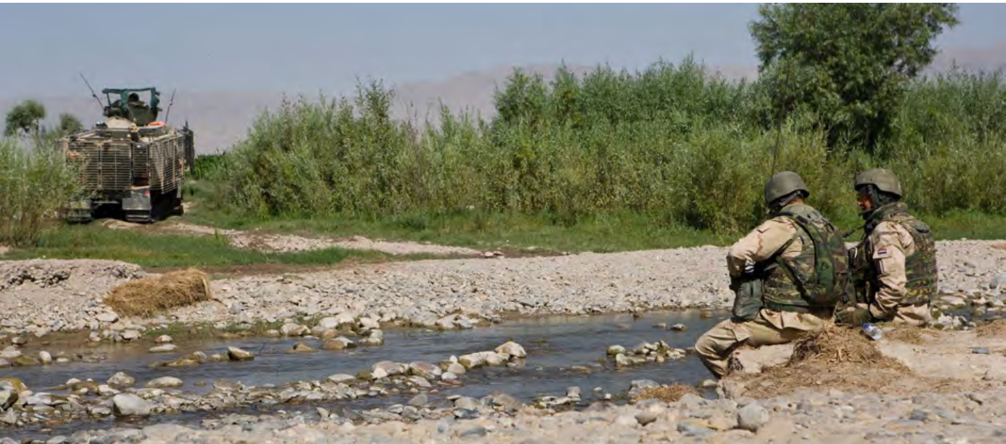
In een wadi nabij Tarin Kowt, Afghanistan. Ook situaties die gerelateerd zijn aan het thuisfront kunnen tijdens uitzendingen morele dilemma's opleveren