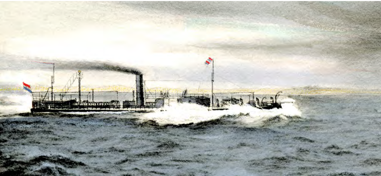
Adaptive resilience: als de Zr. Ms. Adder in 1882 met man en muis vergaat, wordt in Nederland de kustwacht opgericht