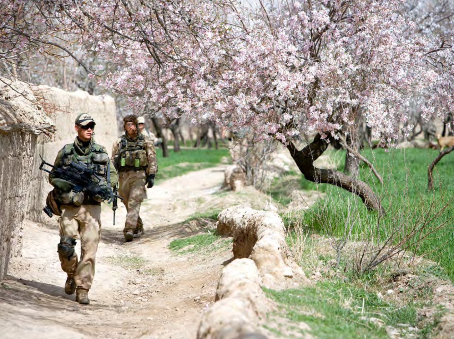
Patrouille in de Baluchi-vallei, Afghanistan, maart 2009. Nationaal en internationaal is er nog weinig empirisch onderzoek gedaan naar hoe moraliteit in de militaire context werkt