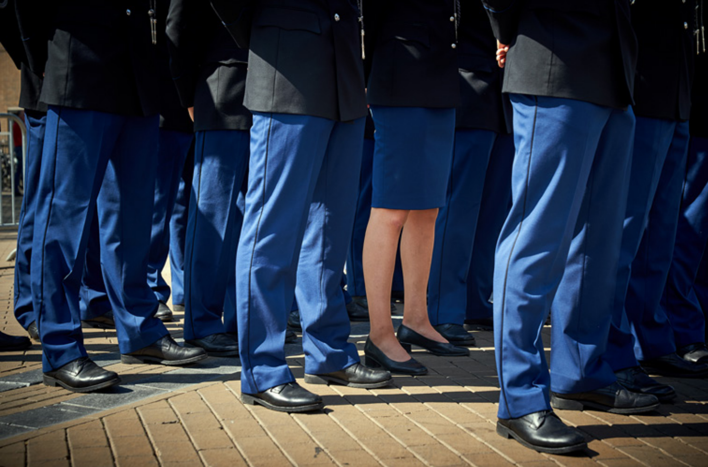
Een consequentie van de regelreflex bij Defensie is dat vrouwen juist nog meer in de schijnwerpers belanden