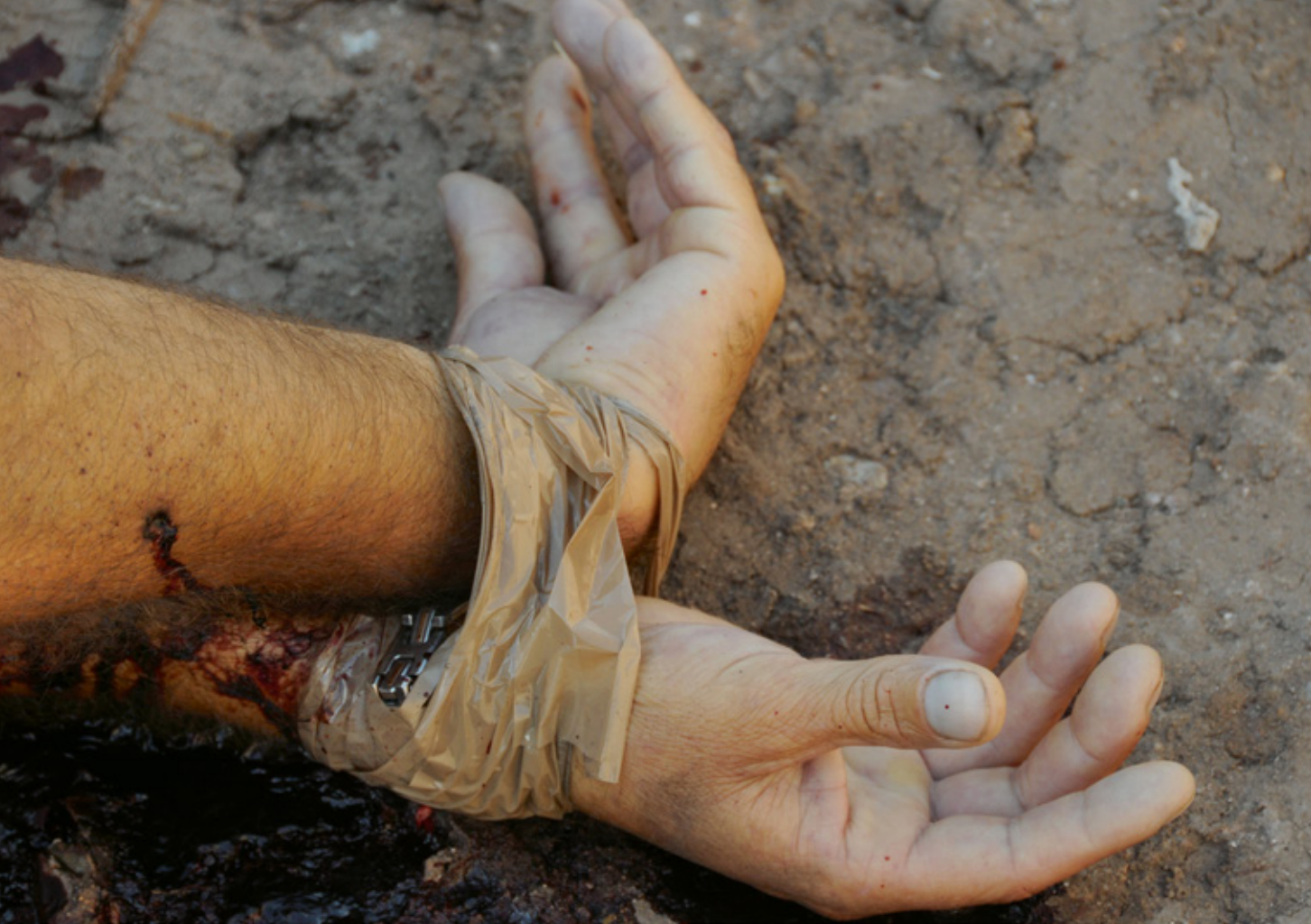
Slachtoffer van de drugsoorlog in Culiacan in de Mexicaanse deelstaat Sinaloa (2009)