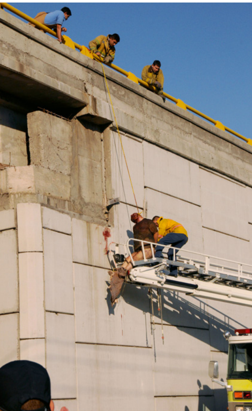
Slachtoffer opgehangen aan een viaduct. Geweld in Mexico is niet willekeurig, maar wel een keiharde boodschap (Culiacan, 2009)