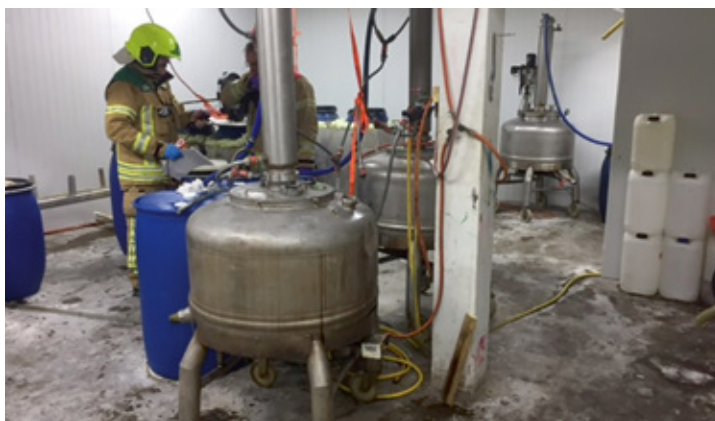
Bewijzen van drugshandel en -productie. Begin oktober werd middenin een woonwijk in Eindhoven een vrachtwagen met chemicaliën in brand gestoken