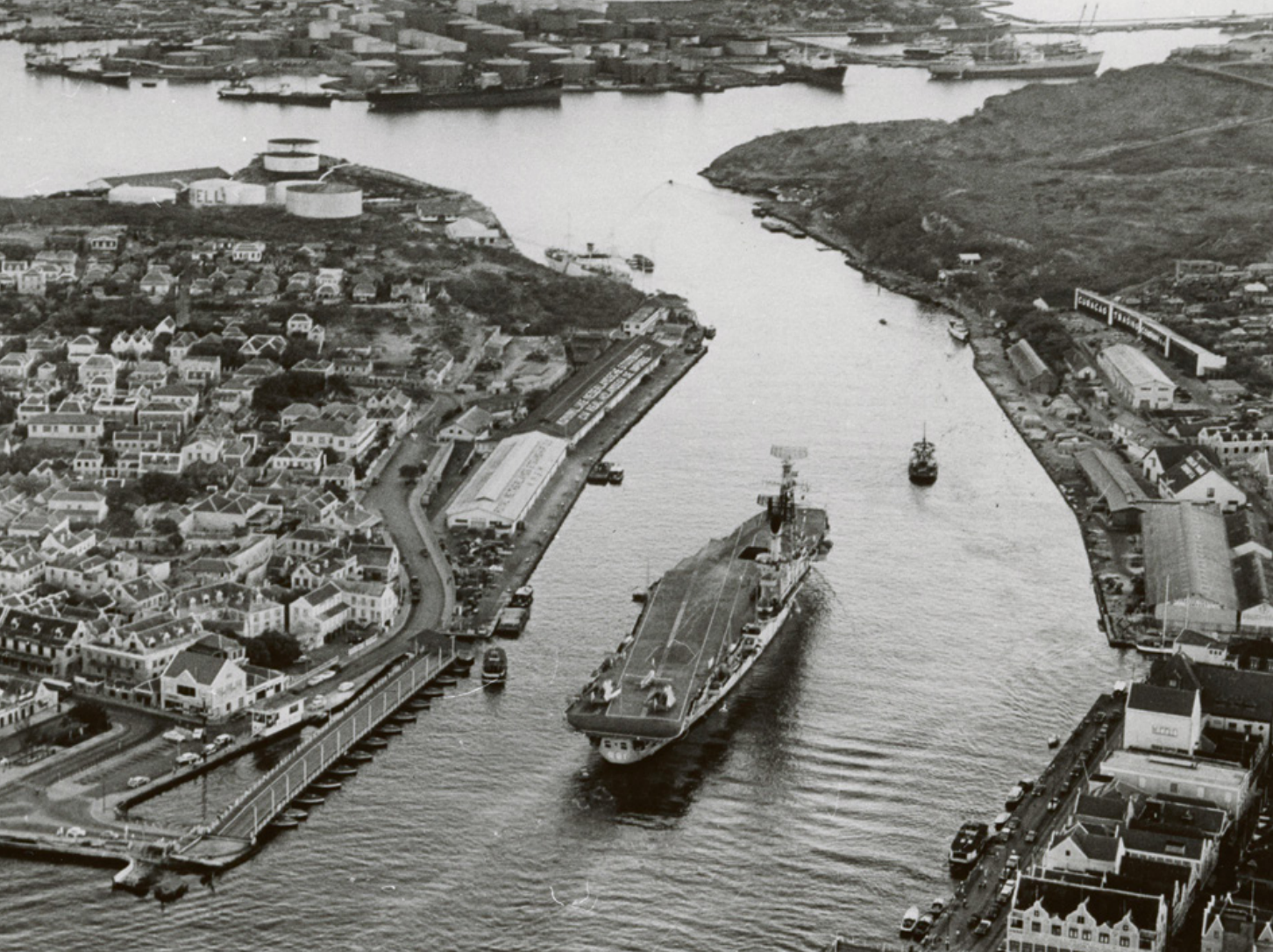
Het vliegkampschip Hr.Ms. Karel Doorman in de Sint Annabaai, 1948. Op de achtergrond de Shell-raffinaderij