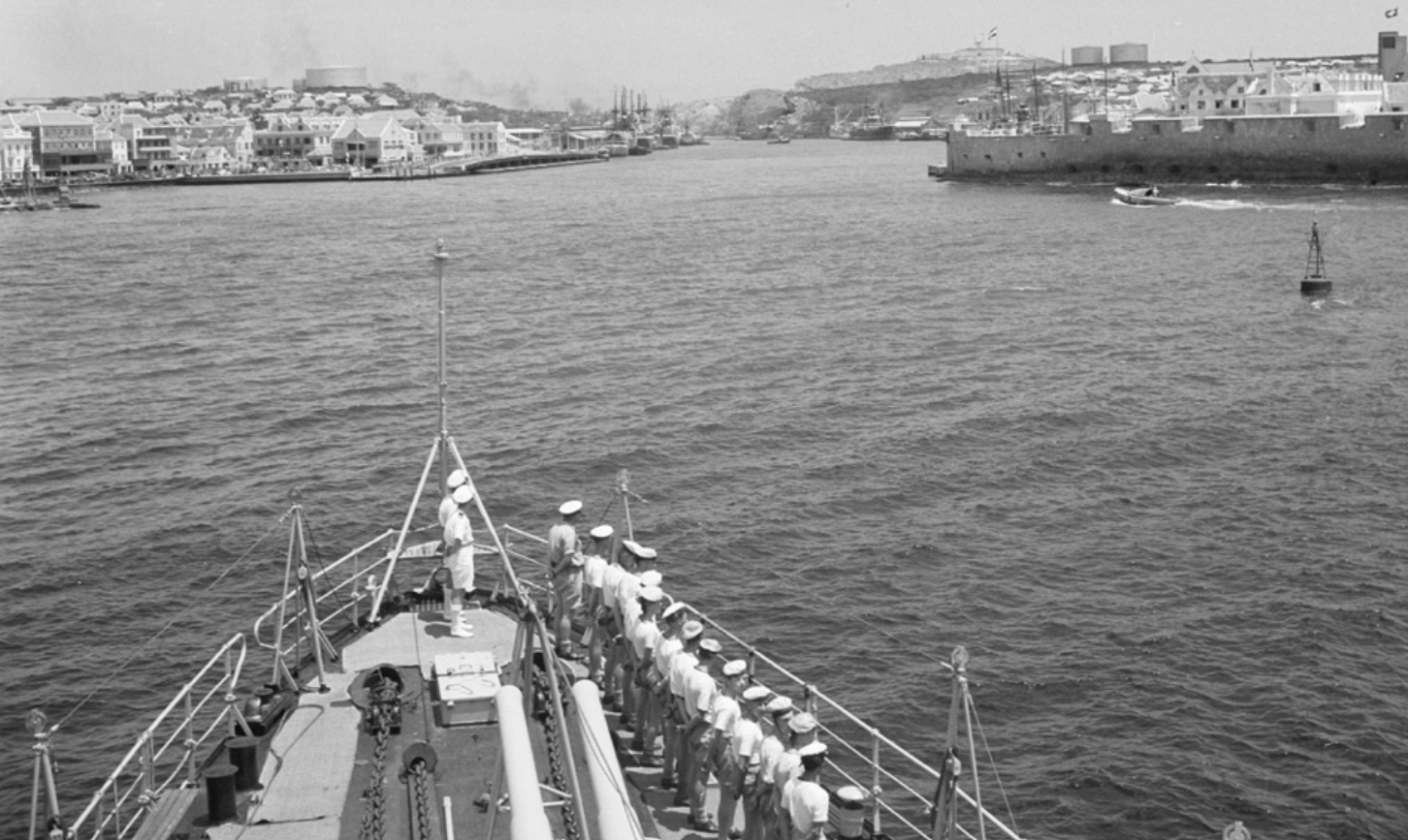
Paradeerrol aan boord van stationsschip Hr.Ms. Van Speyk bij het binnenlopen van de Sint Annabaai, 1946