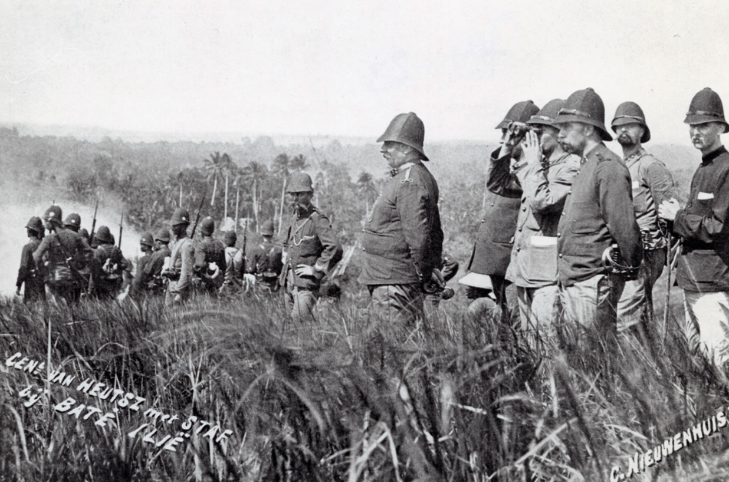
Van Heutsz (midden op de foto) en zijn stafofficieren (staande achter hem) in Atjeh, 1901