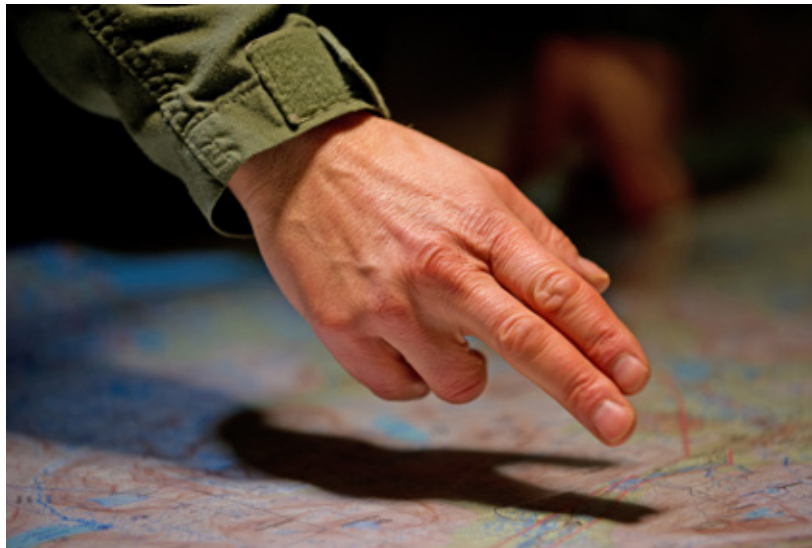
De vermeende mate van richtingsgevoel kan bijdragen aan heersende normbeelden over wat een 'goede' militair is

verantwoordelijkheid om als vertegenwoordiger van gevoelens van cadetten op de KMA op te treden, omdat ik zulke sensitieve onderwerpen heb onderzocht. Het bevestigt opnieuw hoe relevant dit onderzoek is.