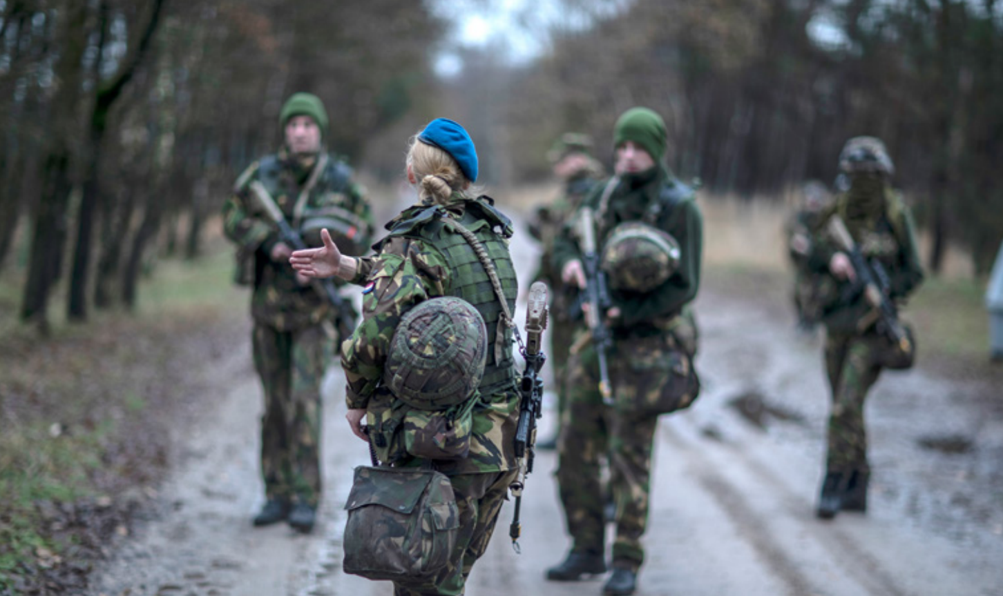
Bivak van KMA-cadetten