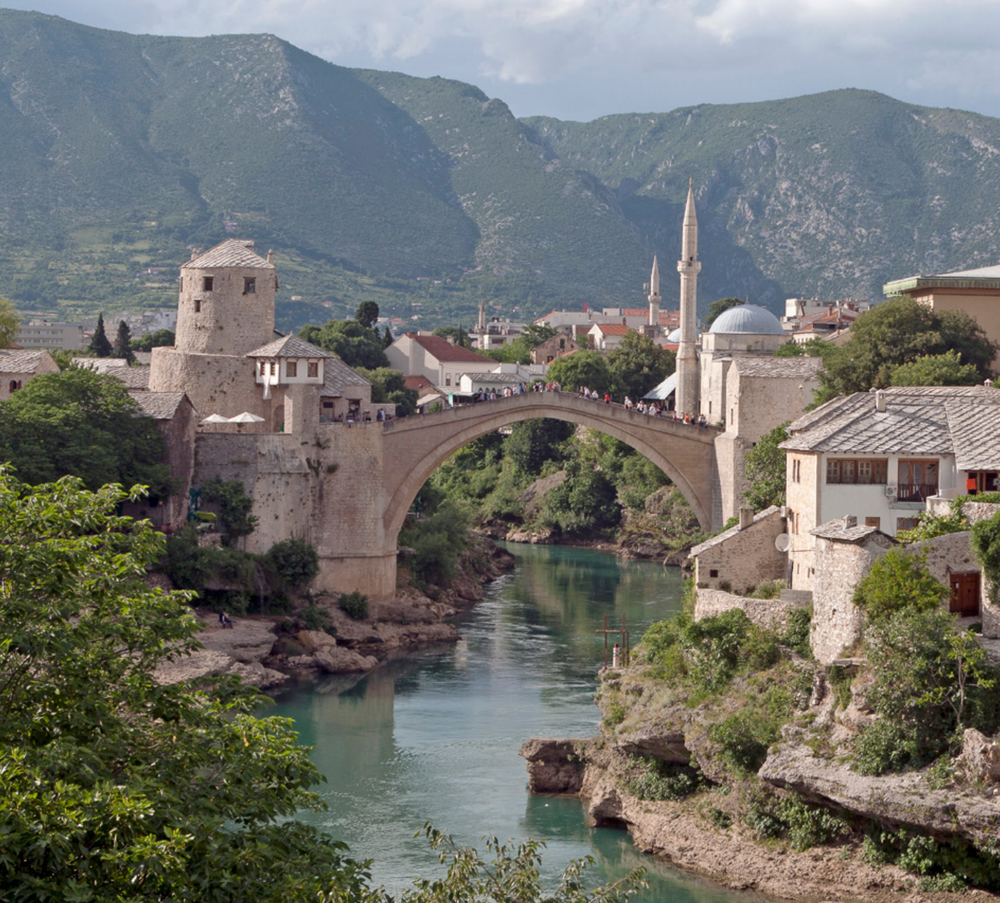
De herbouwde Stari Most

van de brug en andere feiten. Het opmerkelijke was hierna dat ze in hoger beroep juist weer zijn vrijgesproken voor de vernietiging van cultureel erfgoed. Reden hiervoor was dat volgens de beroepskamer de Stari Most toch wel een duidelijk militair doel was. Dat maakte dat een belangrijk element van de aanklacht, vernietiging van cultureel erfgoed niet gerechtvaardigd door