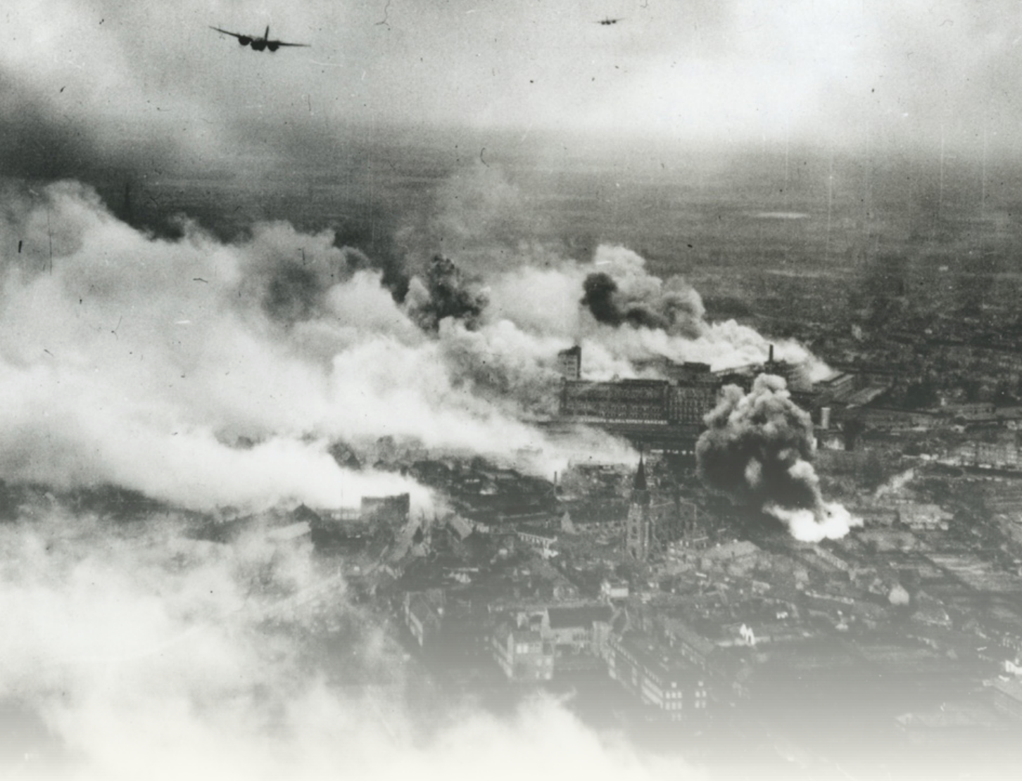
Bombardement op Eindhoven in 1942 door de Royal Air Force. Cultureel erfgoed werd tijdens de Tweede Wereldoorlog vaak niet opzettelijk vernietigd, maar er was ook geen beleid om het te ontzien