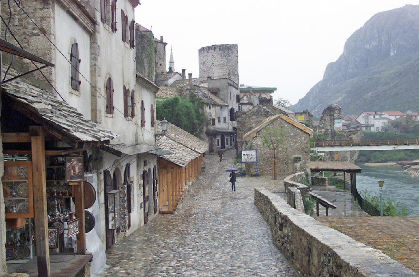
De Bosnische stad Mostar, met op de achtergrond restanten van de kapotgeschoten brug